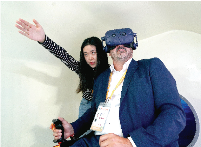
■11月5日,一位西班牙参展商(右)在“深海勇士”号模拟舱中体验深潜。