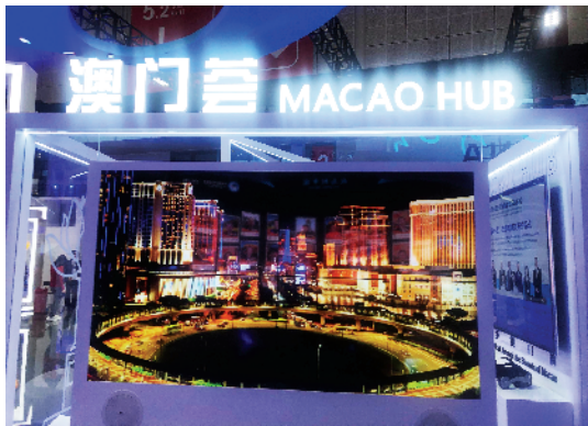
■澳门展区以“澳门荟”为主题。

除了“上天入海”,还能仰望星空。在“深海勇士”号装置旁边,是“中国天眼”FAST,它是具有我国自主知识产权、世界最大单口径、最灵敏的射电望远镜。FAST装置看上去小小的,但一戴上VR眼镜,你就能看见光年之外的脉冲星。目前FAST已发现132颗优质的脉冲星候选体,其中有93颗已被确认为新发现的脉冲星。