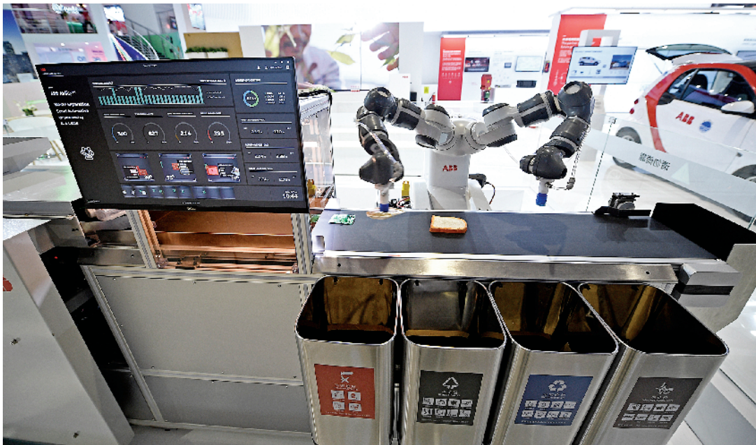
■ABB集团展出的全自动垃圾分类设备。