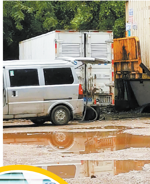
■一男子从箱式货车中抽出油管给面包车加油。