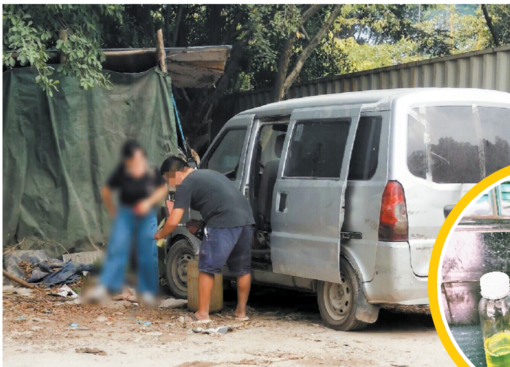
■“停车场”的负责人给记者打了半瓶柴油。