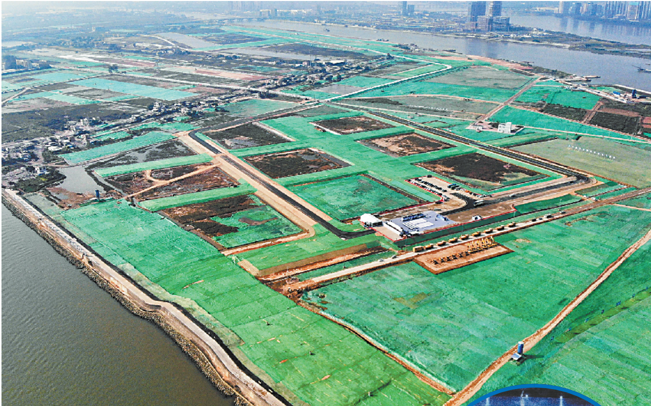
■南沙国际金融岛选址位于南沙明珠湾核心区横沥岛尖南侧,占地面积约 2.27 平方公里。

新快报记者昨天了解到,作为南沙国际金融岛首批拟落户项目之一,IFF 永久会址项目投资规模 35 亿元,用地规模为 24 万平方米,总建筑面积 30 万平方米。IFF 永久会址项目由国际会议中心、国际会议服务酒店、服务公寓和政要公馆构成。金融岛将以 IFF 永久会址为核心,逐步引入全球金融高端要素资源,打造集合国际交往、金融创新、生态保护等功能为一体的综合性全面可持续发展社区、金融产业创新集聚区和高质量国际化的城市综合体。