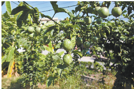
■杜塘村百香果示范田。