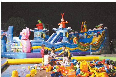
■ 揭阳普宁占陇镇下寨村,从前的垃圾场,如今是一处风景优美的生态园旅游区。