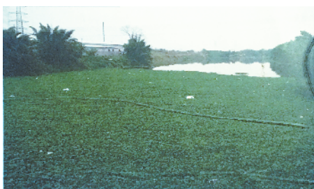
■ 整治前的练江,水葫芦遍布,鱼虾无处生存。