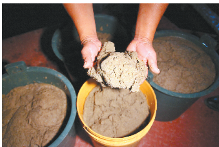
■ “涂虾”重现,说明榕江水质已经大大好转,可以孕育鱼虾。