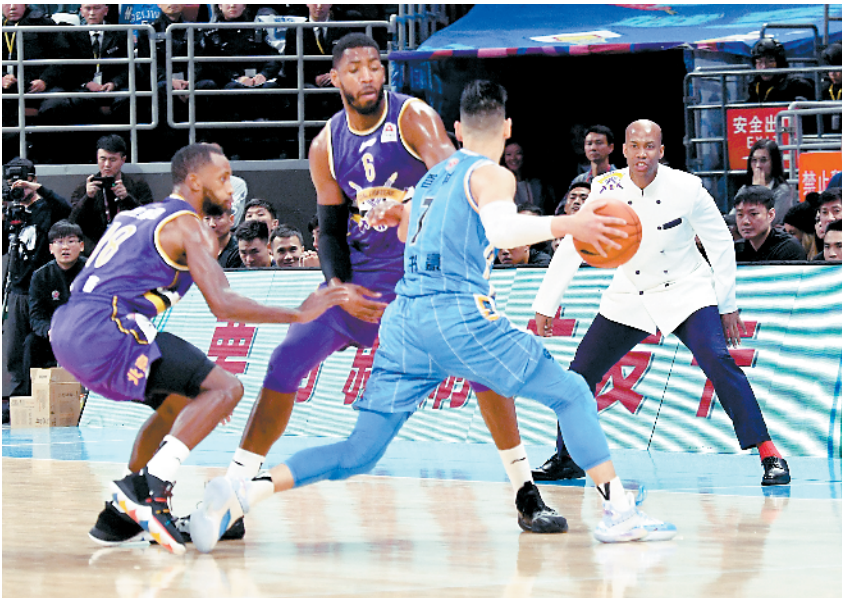
■在一场比赛中，马布里穿着白色双排扣中山装，被网友调侃“像极了全聚德的大师傅”。

据新华社电 京城德比，首钢 21 分惊天逆转，朱彦西压哨三分绝杀；最后 4.2 秒，面对郭艾伦的贴身防守，全场砍下 44 分的富兰克林三分穿心，力助山西绝杀辽宁；江苏对阵福建，史鸿飞篮下神奇挑篮加时绝杀福建。两天三场绝杀，毫无疑问是上周 CBA 的最佳注脚。 紧张刺激的比赛越来越多，最后关头决胜负的球越来越多，越来越多的本土球员站出来决定比赛，不少球迷直呼“现在看 CBA 需要速效救心丸”。 精彩比赛除了球员的奋力搏杀、教练的用兵部署，更离不开裁判的准确吹罚和裁决。上周 CBA 官方公布了 17 场裁判报告，指出其中共有 5 场 7 次错判，总体判罚正确率有所提升，报告中对于动作描述、临场处理、违犯队员、被违犯队员、判罚结论等都有详细阐述。虽然仍然没有完全杜绝错判，第