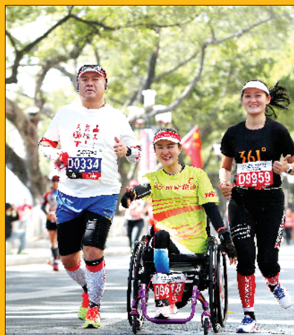
■跑广马，最紧要开心啦。