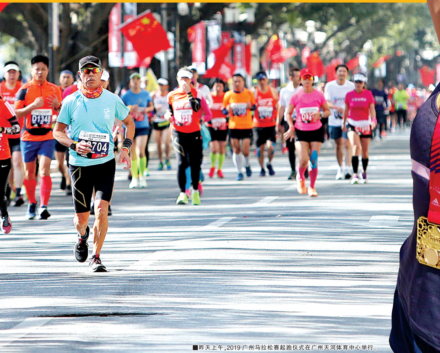
■昨天上午,2019广州马拉松赛起跑仪式在广州天河体育中心举行。