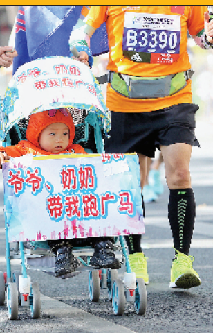
■“嘻嘻,我是来打酱油的!”