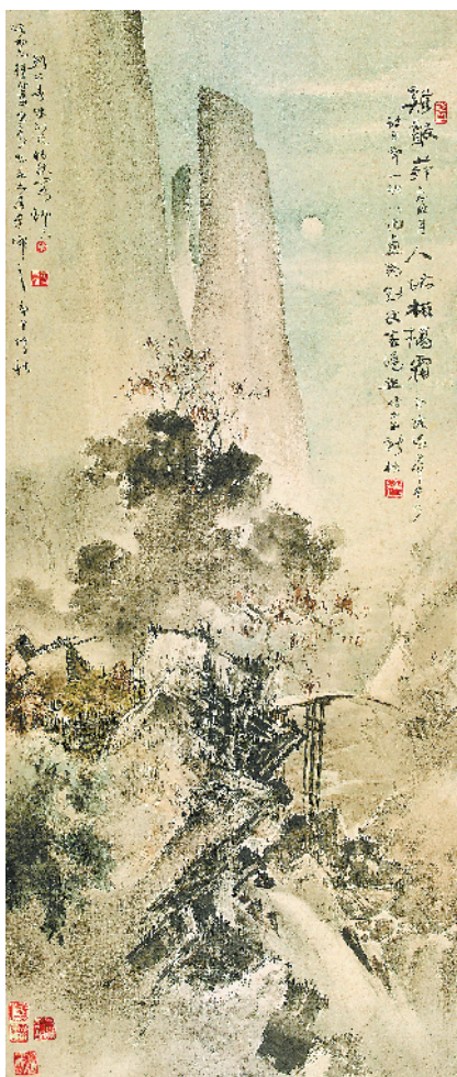
■粤海弄潮——院藏高剑父、高奇峰绘画展 高剑父《鸡声茅店月图轴》