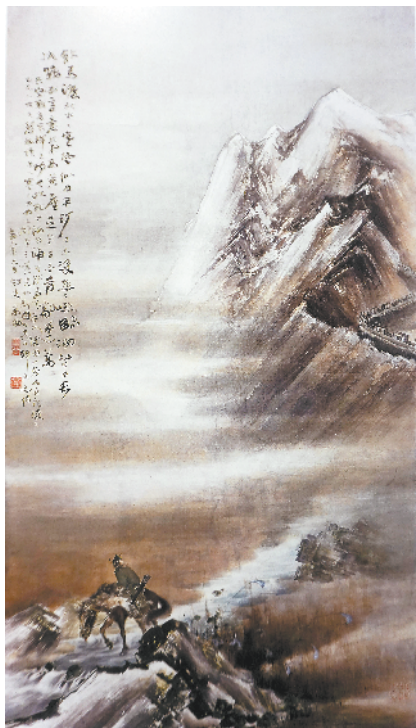
■饮马渡关图轴—高剑父广东省博物馆藏 1917 年