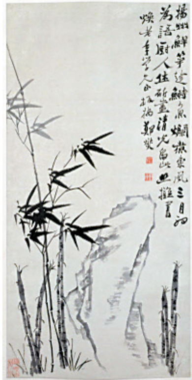
■郑燮(清) 竹石图 轴(故宫博物院藏)

最好的中国艺术史入门书，牛津、耶鲁、普林斯顿沿用 40 年之经典读本。牛津大学荣休院士、中国艺术史权威迈克尔·苏立文院士继《20 世纪中国艺术史》之后又一重磅力作《中国艺术史》，通过梳理远古、先秦、秦汉、三国六朝、隋唐、五代与两宋、明清直至 20 世纪的中国艺术，将中国艺术的不同门类——建筑、雕刻、绘画、书法、陶瓷等在不同时代的表现形式及特点清晰、细致、全面地展现在了读者面前。