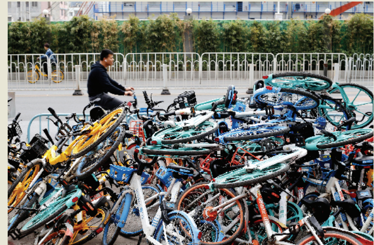
■天河区冼村路,共享单车被杂乱地堆在一起。