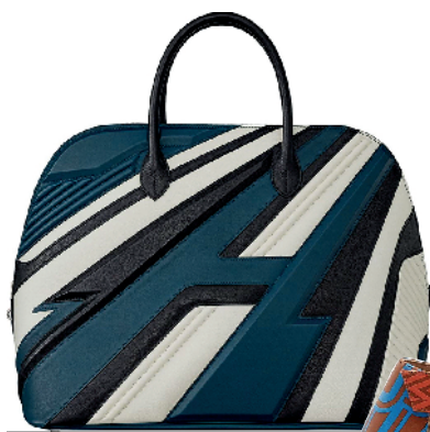
▲ Bolide1923-45 小牛皮手袋以摩托车和赛车服为灵感。