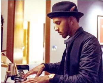
■汉密尔顿表示自小喜欢音乐。资料图

我都要去赛场,早上7点起床,出发,然后在赛场度过一整天,晚上匆匆忙忙吃饭,然后回到酒店,我才有时间搞搞音乐。和很多做音乐的人一样,我会想跟上流行、会想不断改进让歌变得更好听、会想怎么把自己的嗓音变得更有感染力,我也很想让大家早点听到我的歌,但目前来说,它还是‘私密’状态的。”