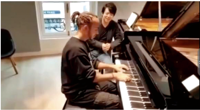
■汉密尔顿在朗朗面前有模有样。 视频截图

在2015年前后,有消息称他曾计划发行已经录制好的多首歌曲。后来因为日程安排繁忙,此事不断延后。2017年,汉密尔顿造访中国时也谈到这事。他表示,目前还抽不出精力时间来搞音乐。他当时说:“现在对我来说,留给我做音乐的时间太少了。比如像这样的比赛周,到了以后的每一天