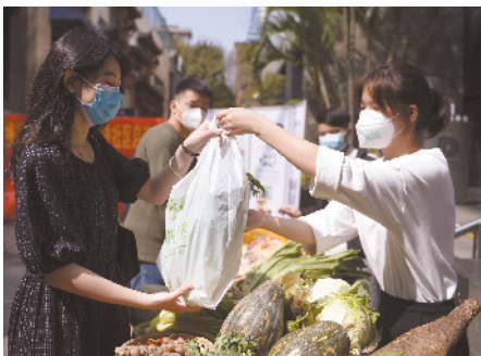
■居民在选购清远的农产品。