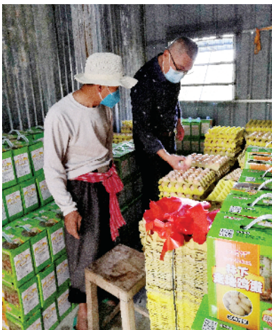
■ 鸡蛋有了销路,扶贫户再也不发愁了。