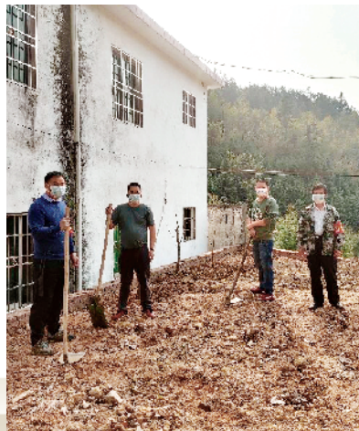
■ 扶贫干部和村民一起种桃树,美化村貌。