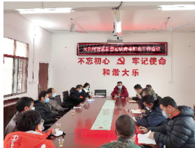
■ 扶贫工作组和村两委开会继续部署疫情防控。