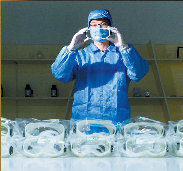
■3D打印应急全封闭护目镜运用光敏树脂的优点,材质光滑、防水防湿、精度高,而且成型速度快,很适合抗疫紧迫的形势进行小批量快速生产。