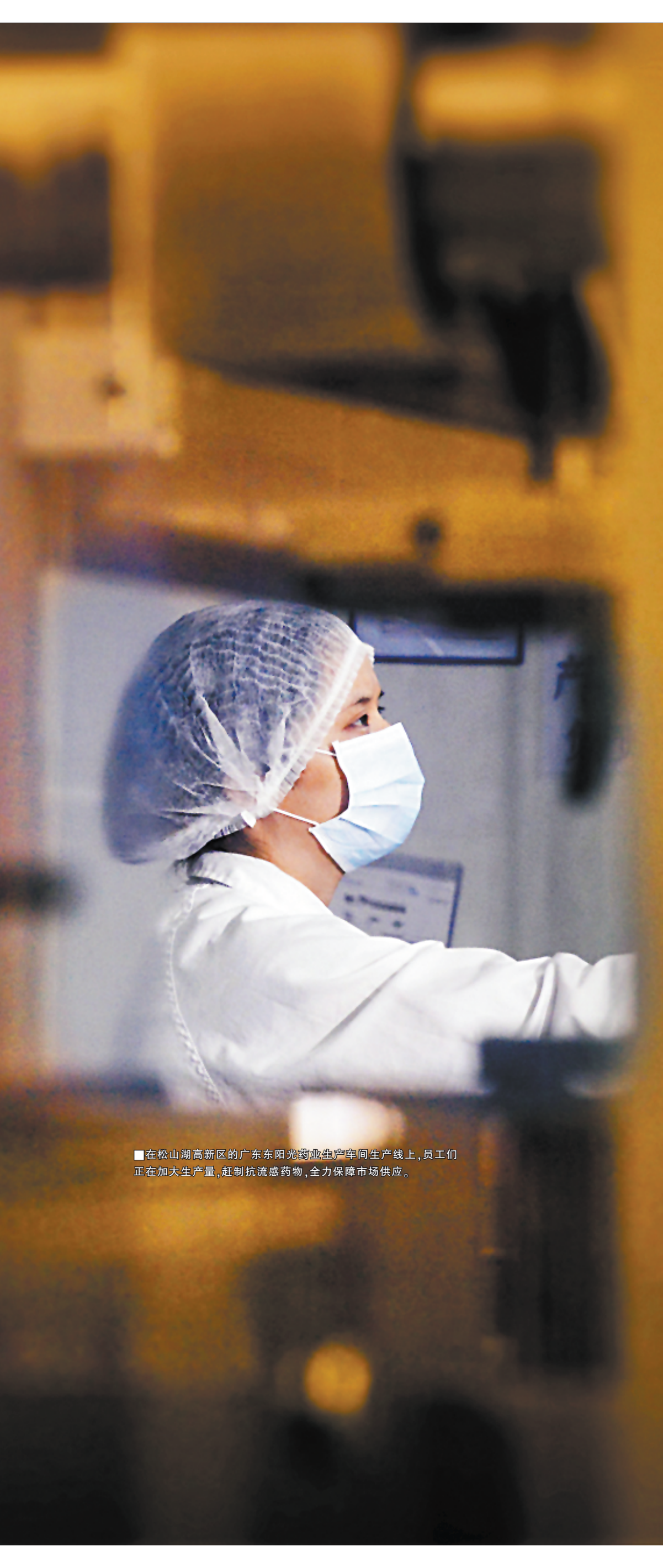
■在松山湖高新区的广东东阳光药业生产车间生产线上,员工们正在加大生产量,赶制抗流感药物,全力保障市场供应。