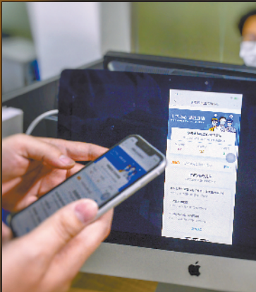
■科兜网启动灵活复工制度,利用线上沟通在家办公的方式,并联合东莞市高新技术产业协会开发“供需通—抗疫专栏”平台。疫情期间,该平台帮助企业完成口罩采购5万件,消毒液等各类防疫消毒物资40多吨。截至目前,平台共发布防疫供应114项、防疫需求122项,完成团体防疫采集31次,在助力企业进行疫情防控方面取得显著成效。