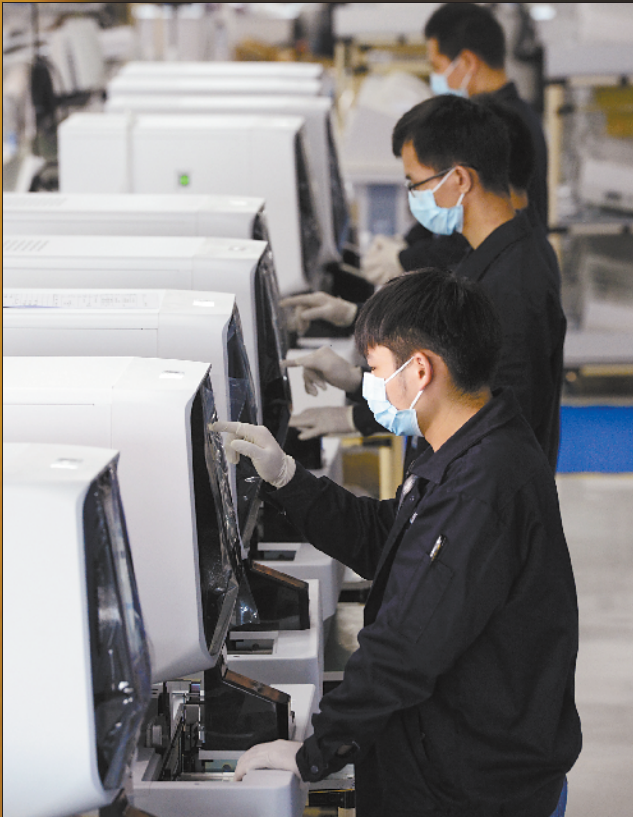
■“东莞制造”复工复产秩序井然,抗疫产品设备物资正源源不断出厂发往疫区。