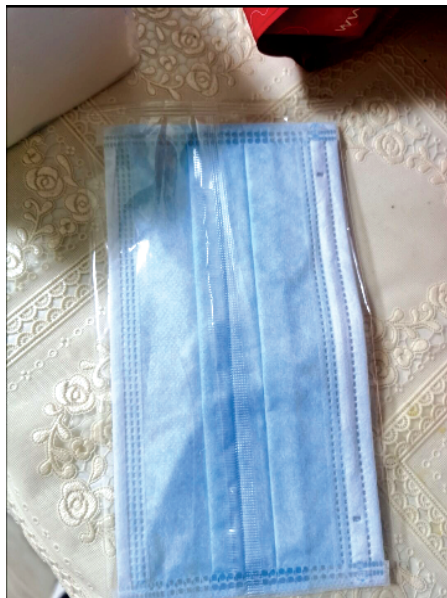
▲消费者称在健客网上买到的口罩包装上无任何标识。