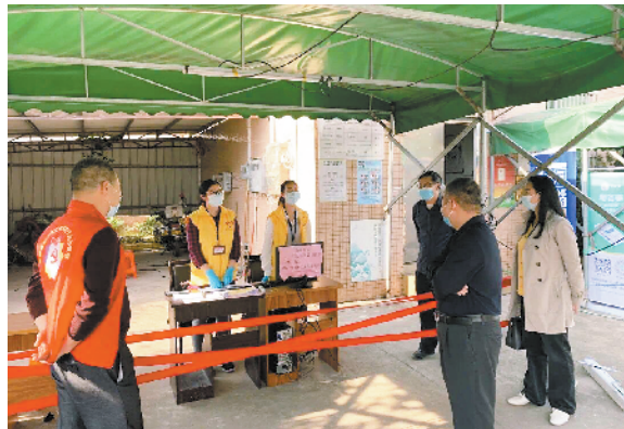
■体彩中心一线人员助力企业复工复产