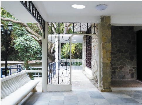
■周总理曾经下榻的甲座。