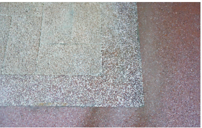
■地面是上世纪 60 年代特征的水磨石,以建筑内残留的水磨石地面为参考,用现在的水磨石工艺和材料复原。