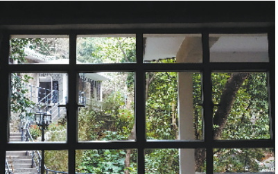
■恢复了乙座铝合金门框、窗框,“这在当时算比较超前。