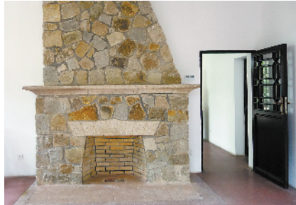
■甲座内的壁炉是原物。