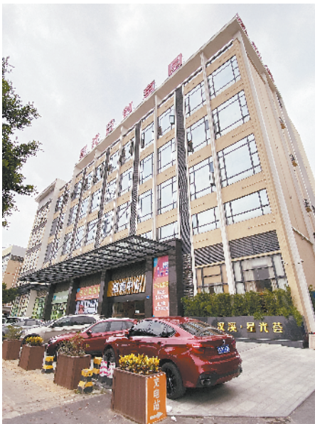
■番禺的星光荟大厦。