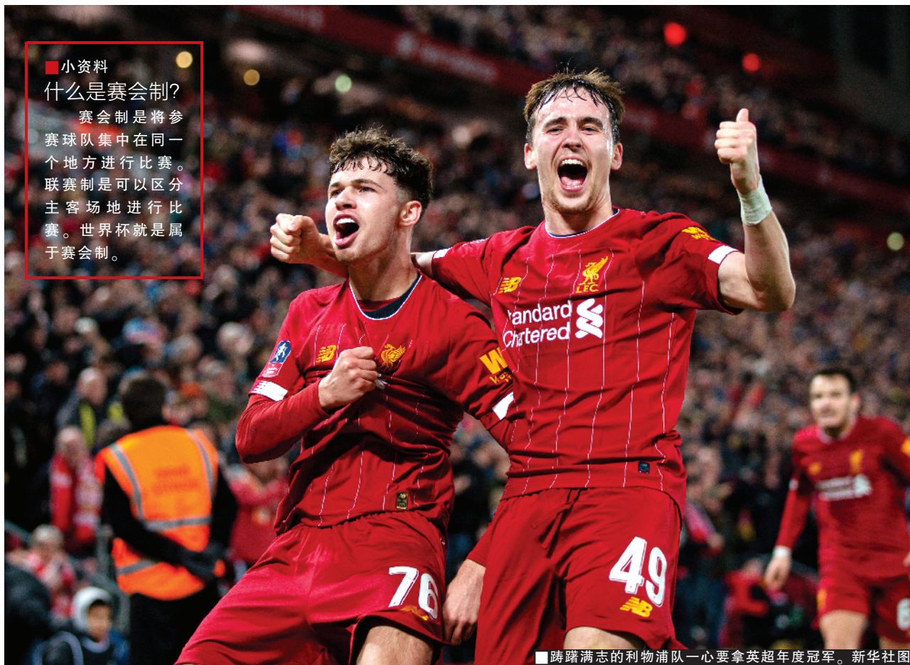
■踌躇满志的利物浦队一心要拿英超年度冠军。

赛会制是将参赛球队集中在同一个地方进行比赛。联赛制是可以区分主客场地进行比赛。世界杯就是属于赛会制。