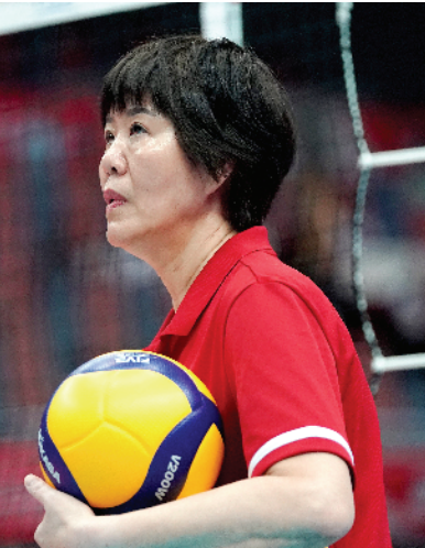
■随着东京奥运会的延期,中国女排主帅郎平的合约也顺延了一年。

另外全运会在中国体育系统中的重要性不言而喻,几乎所有奥运选手都将参与其中,若是与奥运会举办的时间挨得太近,对选手们的身体状态将是一项巨大挑战。陕西省体育局副局长徐鹏日前在接受采访时表示,第十四届全运会是否会调整时间,目前依然无法确定。