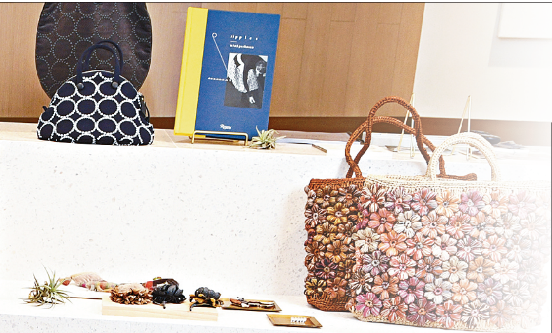
■新快报记者 梁彧/文