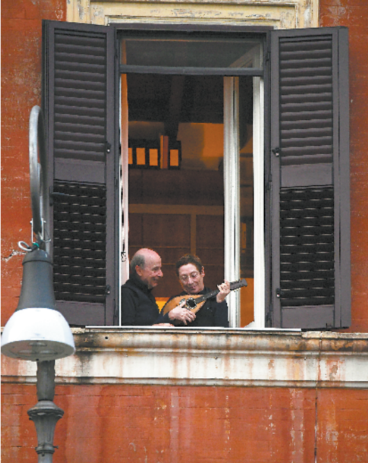
■疫情也挡不住意大利人对音乐的热爱。在意大利首都罗马，市民在晚上六点推开窗户参加抗击疫情的快闪活动。