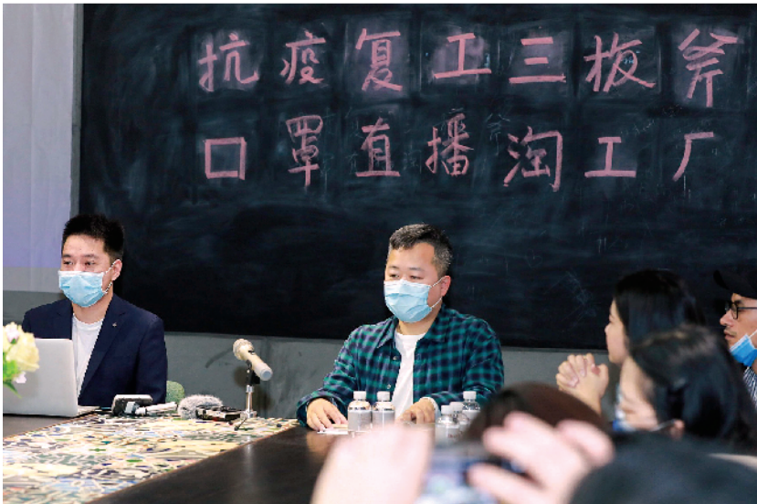
■勇敢走进直播间带货的番禺服装厂长们

达成打造直播基地的决定。“不仅是为了度过眼前的危机,更是为了未来的数字化转型而战。”