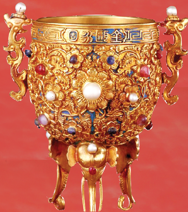
■乾隆年制 金瓯永固杯 故宫藏