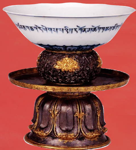
■青花藏文高足碗及银鍍花纹碗座 布达拉宫藏