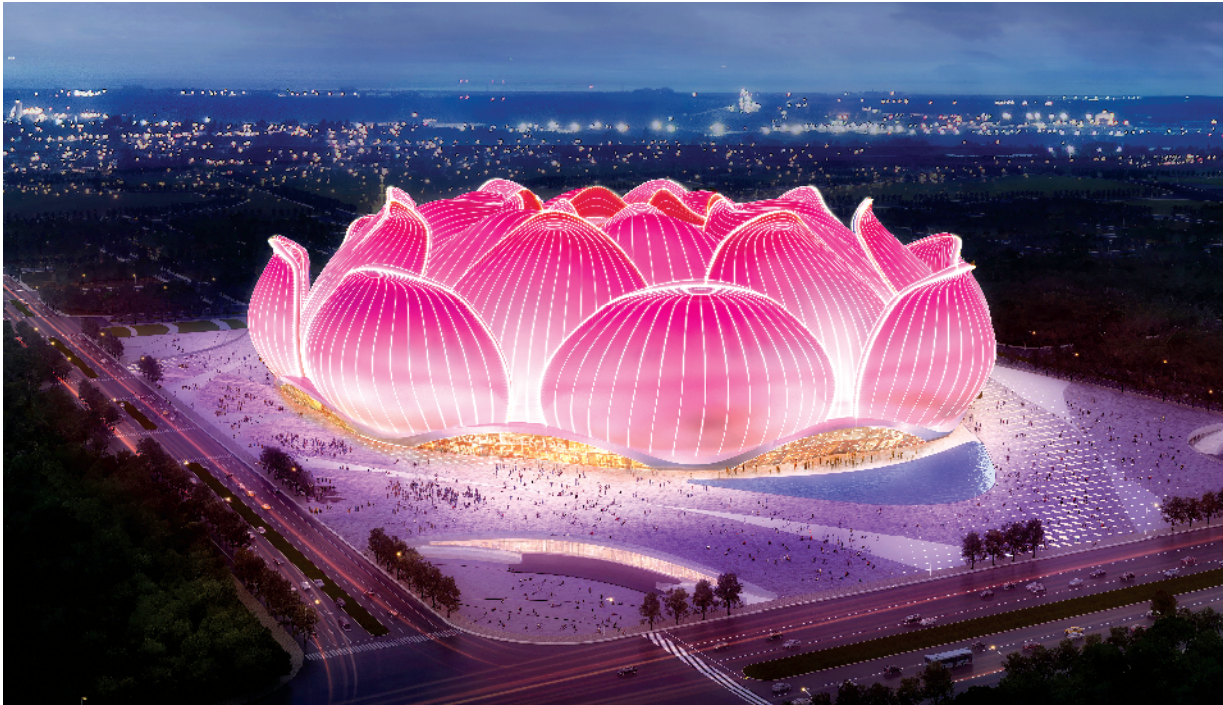
■恒大足球场效果图

体育产业是上游产业,足球场建设可以吸纳更多体育赛事落地番禺,有助于吸引旅游业、娱乐业、商业、宾馆业、会展业、房地产业、餐饮业的集聚形成集聚效应,有力带动城市第三产业和周边区域的整体发展,提升商圈经济。