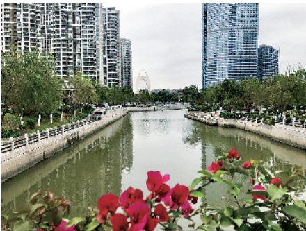
■猎德涌两岸绿树红花摇曳。