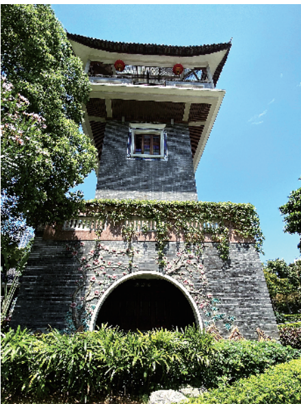
■猎德涌旁古建筑成美拍打卡地。

晚春时节,新快报记者来了一次天河区河涌游,只见到处是春光明媚、水清见石、鱼翔浅底的景象。