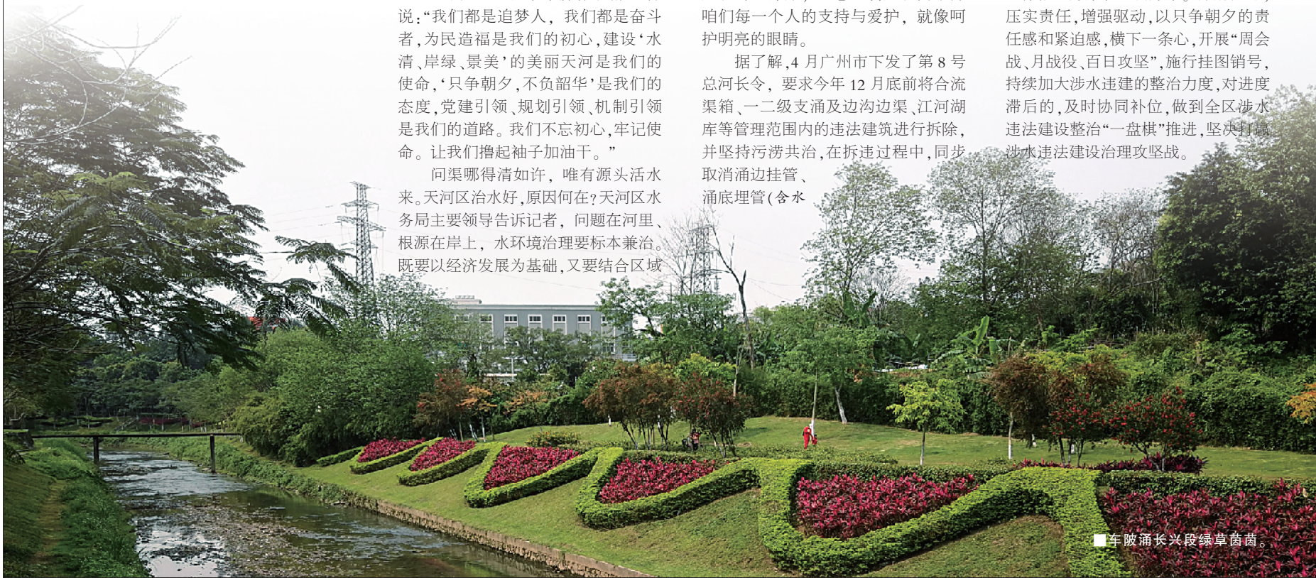
■车陂涌长兴段绿草茵茵。

下一步,天河区将继续按照广州市第8号总河长令要求和部署,抓紧制订总体推进方案和配套方案。分解任务,压实责任,增强驱动,以只争朝夕的责任感和紧迫感,横下一条心,开展“周会战、月战役、百日攻坚”,施行挂图销号,持续加大涉水违建整治力度,对进度滞后的,及时协同补位,做到全区涉水违法建设整治“一盘棋”推进,坚决打赢涉水违法建设治理攻坚战。