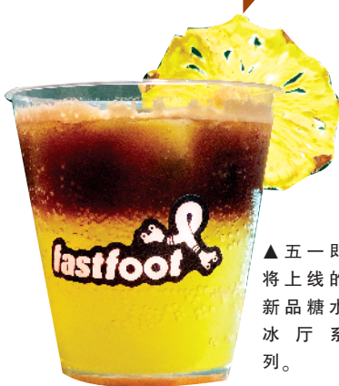
▲五一即将上线的新品糖水冰厅系列。