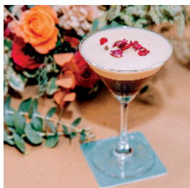
▲经典 Espresso，让“少女心”已漫出咖啡杯。