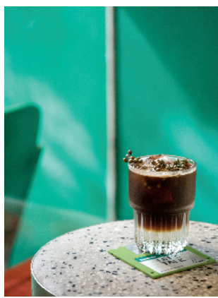
▲藤椒咖啡是打卡必点的招牌创意咖啡之一。