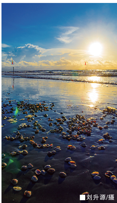
深圳大鹏半岛金沙湾 地址:广东省深圳市龙岗区大鹏镇