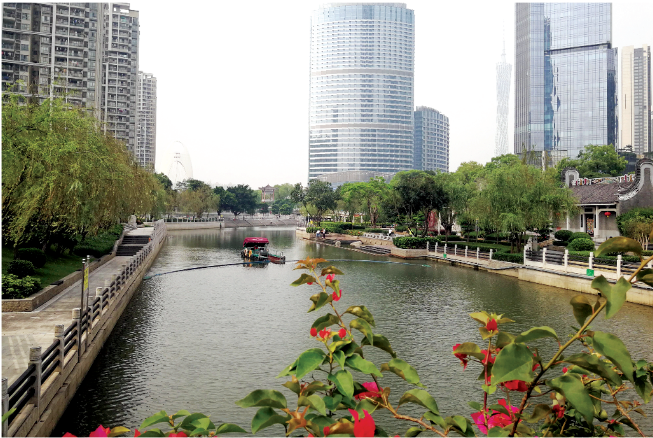
■猎德涌花城大道段水清、岸绿、景美。

据介绍,河涌碧道建设有六大功能:防洪排涝功能、发扬优秀传统文化功能、塑造城市景观功能、为市民提供游玩场所的功能、调节气候和净化空气的功能、带动河涌周围经济发展的功能。所以,猎德涌有必要进行水利整治,同时结合城市景观,升级改造水生态。