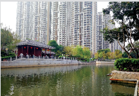
■猎德涌粤韵文化戏台

据悉,天河区除了在猎德涌碧道建设中发扬猎德鼓等民俗文化,还在车陂涌发扬龙舟民俗文化,在深涌中支涌发扬七巧民俗文化,在水环境的治理过程中不断探索,助力城市现代化发展和乡村振兴及农村现代化发展。