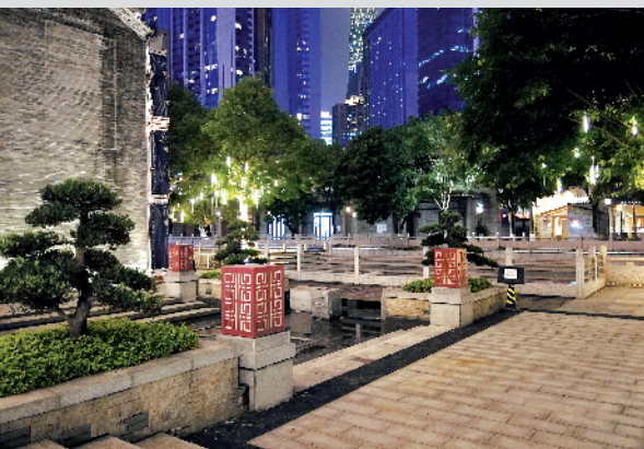
■猎德涌亲水平台夜景