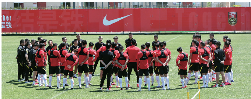
■5 月 12 日,国家男足主帅李铁(中)在训练场上与球员交流。

新快报讯 记者高京报道 正在上海集训的中国男足将于明日(26 日)迎战热身赛的第二个对手上海申花队,目前球队正在紧张备战中。队内状态正好的前锋谭龙表示,期待能够为国足打入