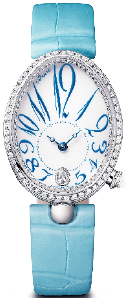
宝玑那不勒斯王后系列 ▲ 8918 腕表

进入夏天,衣裳单薄,把诸多搭配空间留给了手部和颈间。打造腕上的风景线,是夏日里时髦女郎把玩得亦乐乎的时尚游戏之一,而本季,C位当属优雅蓝调。