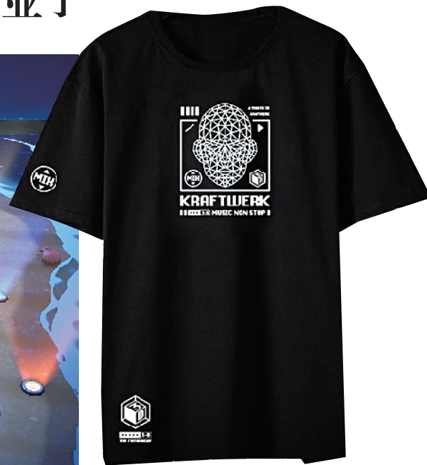
▲2020 年度致敬 Tee