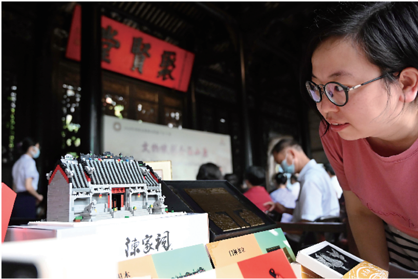
■现场展示的优秀文创产品吸引市民驻足观赏。