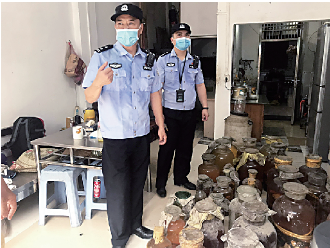
■警方在一次行动中发现多种野生动物。

6月7日,新快报记者再次就《工伤赔偿协议书》相关情况向该公司求证,该公司并未给明确答复。