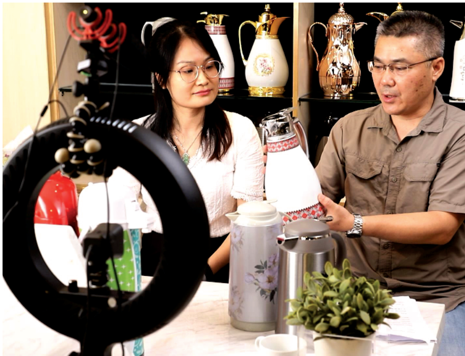
■广交会开幕前,广州轻工集团股份有限公司员工在排练直播。