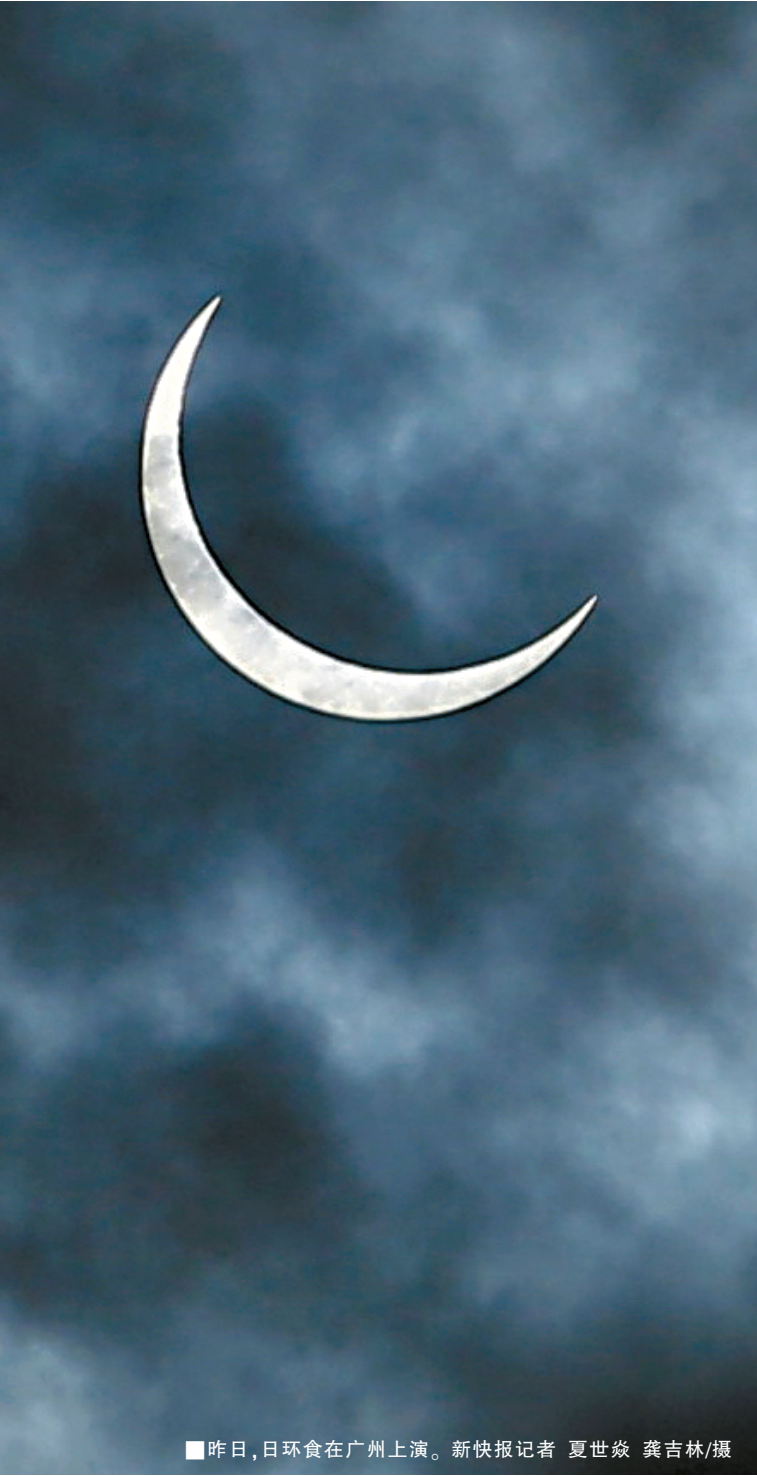
■昨日,日环食在广州上演。