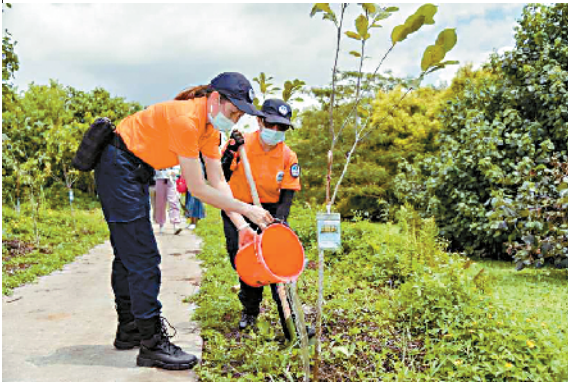
■市民为南粤添绿,助力湾区林业建设。

新快报讯 记者黎秋玲 通讯员林荫报道 “生命在于绿色,盼望在于绿色”!6月20日,由广东省绿化委员会、广东省林业局指导的广东林业·腾讯网友植树节在广州南沙湿地公园举办。现场由奥运冠军劳丽诗带领关注绿化生态的网友共同种下近300株树苗,为南粤添绿,助力湾区林业建设。