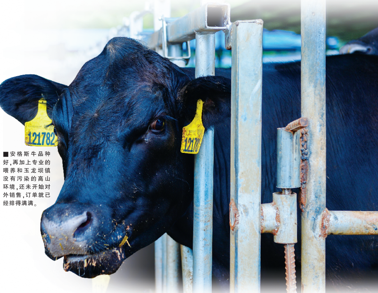
■安格斯牛品种好,再加上专业的喂养和玉龙坝镇没有污染的高山环境,还未开始对外销售,订单就已经排得满满。

“葡萄长廊的项目,也是采用与企业合作的形式,项目建成后政府投入资金总额将按比例于次年年底进行保底分红。”陈艺驰说,该项目覆盖以葡萄长廊为“线”,果园、钓场、农家乐为“珠”的岩脚乡旅项目,是玉龙坝镇由点及面“串珠为链”,依托资源禀赋着力打造的长线乡旅产业。