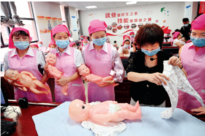
■黔南州都匀市春晖小区内,新的一期家政职业技能培训班正在上课,吸引了附近不少居民前来学习。

“这种专班的模式,关键是能够让贫困学子通过校企订单实现高质量就业,收入水平比在当地高,带动毕节脱贫攻坚工作