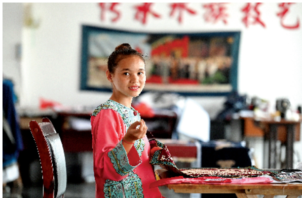
■位于雪花湖易地扶贫搬迁社区内的水族马尾绣扶贫车间,提供了就业岗位,让搬迁群众“下楼即上班”。