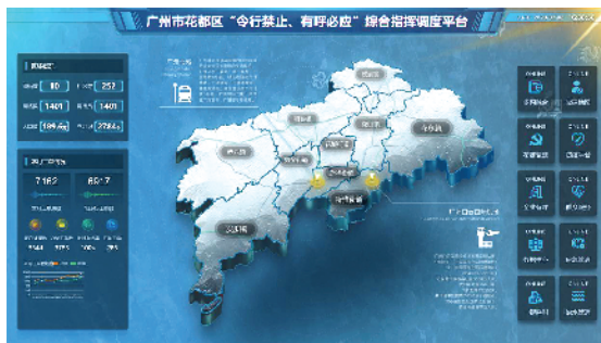
■基层工作人员利用综合指挥调度平台可以快速查找全区的水系、街道、门牌、路灯、井盖等信息。

度派遣、协调处置、跟踪回访、评价结案”的“五步闭环”流程,各负其责、协同联动,形成强大工作合力。