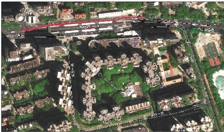
► 施工路段及 周边道路组织 示意图

进行疏导,缓解施工带来的交通压力。请过往车辆及行人留意现场指引标志,听从现场交通引导员指引,合理选择路径,安全通行,不便之处,敬请谅解。广州地铁集团感谢社会各界及市民对广州地铁十一号线华景路站项目建设的理解和支持。(李佳文)