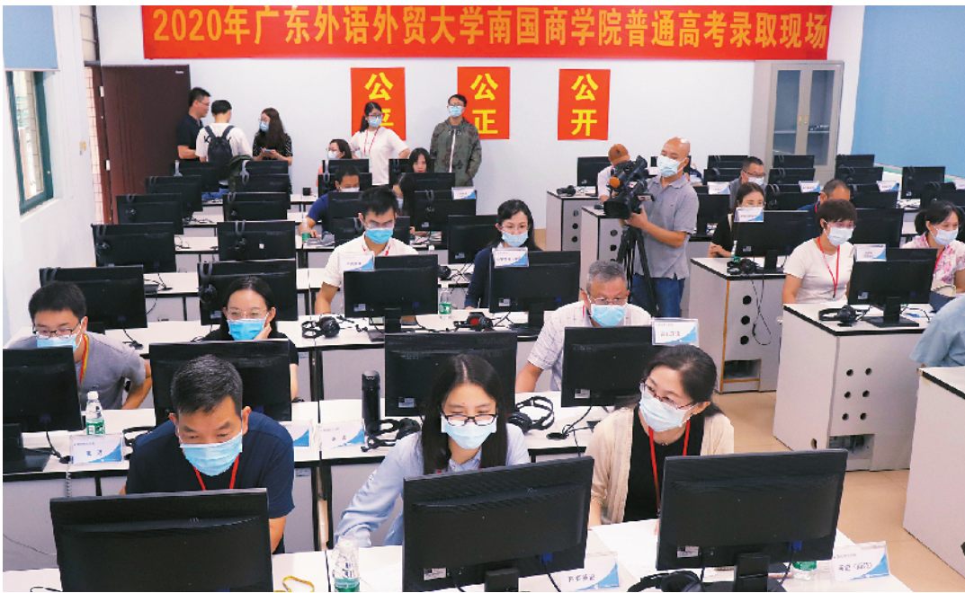
■2020年广东外语外贸大学南国商学院普通高考录取现场。