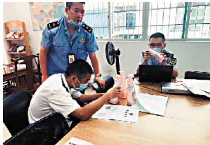
■执法人员进行调查。通讯员供图

互联网绝非法外之地,那些妄图借互联网外衣“傍名牌”的害群之马必须彻底清除。为此,白云区打假工作专班重点经营互联网线上侵权售假违法行为线索,并于近日开展统一收网行动,联合区市场监管局执法大队奔赴云城、人和、嘉禾三地同步实施打击。经现场检查,执法人员分别在广州市某美妆化妆品有限公司、广州市某彩日化科技有限公司、广州某某化妆品有限公司查获侵犯注册商标“coco”专用权的化妆品空瓶34000余个,成品1500余支,并查获3万余支的相关网络销售证据。目前三