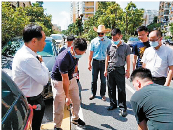
■老马现场指导污染源溯源排查。

随着全区水环境质量一天比一天好,河涌岸线一天比一天美,市民群众一天比一天开心,老马经常皱着的眉头也慢慢地舒展了,笑脸也一天天多了。