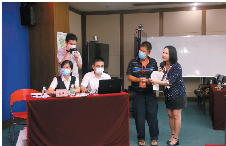
■“购买双色球,汽车开回家”活动第四期抽奖现场。