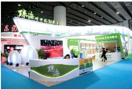
■广东省脱贫攻坚成果展珠海展区。