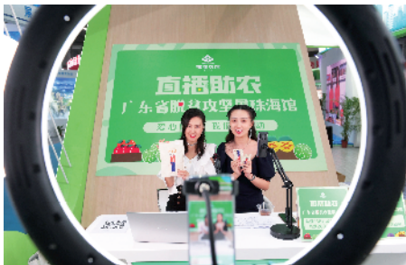
■主播在珠海展区推广扶贫农特产品。