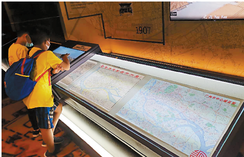
■8月29日,广州市规划和自然资源局在广州市国家档案馆举办全国测绘宣传日亲子研学活动。

此外,在发现美丽的同时,市民们还可以拿起手机,拍摄你心中最美的羊城——不管是自然景观、城市发展,还是人文风貌、市井生活,各类主题皆可投稿。只要在9月29日24:00保持在线人气票数最高的参赛选手,即可获赠精美限量版《广州城市地图集》。