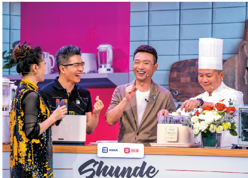
■央视主持人与顺德名厨体验使用顺德家电,烹制顺德美食。

园两家世界500强企业,涌现出一批在全国乃至世界都有影响力的“隐形冠军”企业,是全国最大的电风扇、空调、微波炉、电饭煲、燃气热水器生产基地,拥有“中国家电之都”“中国燃气具之都”“中国涂料之乡”等28个国家级品牌。