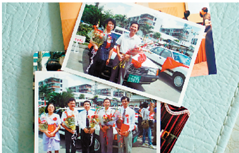
■昔日“科技重奖”获奖者合影。