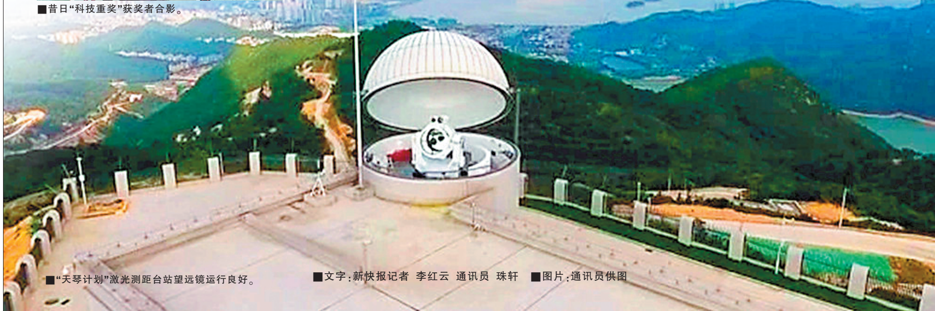
■“天琴计划”激光测距台站望远镜运行良好。

更大的机遇是,《粤港澳大湾区发展规划纲要》的发布为珠海带来更加广阔的发展空间,与澳门共同打造粤港澳大湾区澳珠极点成为珠海的又一道全新课题。当前,珠海正充分把握粤港澳大湾区加快建设带来的历史性机遇,举全市之力积极参与粤港澳大湾区建设,奋力打造粤港澳大湾区重要门户枢纽、珠江口西岸核心城市和沿海经济带高质量发展典范。