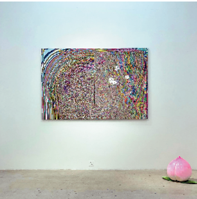
■朱芷慧“转发幸运符号”这个作品，探讨了当代年轻人的“日常生活片段”