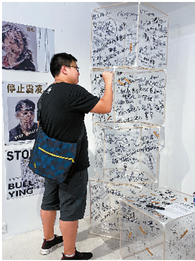
■展览现场的观众互动

设计和创作，最重要的事情，也许就是这样，它具备现实意义，关注了自己，更关注了他人。它有各种或简单或繁复的工具，去采集和触动许多的集体记忆，并在呈现的过程中，实现了自己和他人的和解，与治愈。